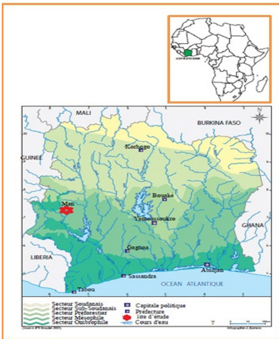
Fig. 1 Présentation de la zone d'étude, dans le département de Man, Ouest de la Côte d'Ivoire / Presentation of the study area, in the department of Man, western Côte d'Ivoire

Pour le contrôle de l'infestation des mollusques, nous avons utilisé la technique d'isolement individuel des mollusques dans des tubes à essais contenant 5 ou 10 mL d'eau filtrée du gîte. Les tubes sont ensuite exposés à la lumière naturelle ou artificielle (tube néon) pendant au moins une matinée. Cette exposition à la lumière entraîne l'émission des cercaires matures dont la présence est mise en évidence par observation des tubes à l'aide d'une loupe binoculaire.